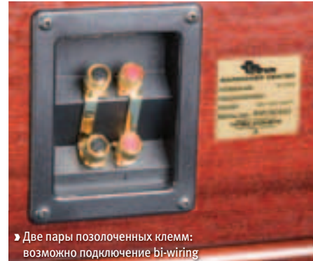
► Две пары позолоченных клемм: возможно подключение bi-wiring