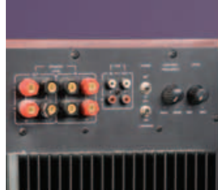
► Сабвуфер можно подключить разными методами