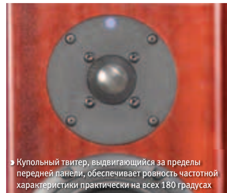
► Купольный твитер, выдвигающийся за пределы передней панели, обеспечивает ровность частотной характеристики практически на всех 180 градусах